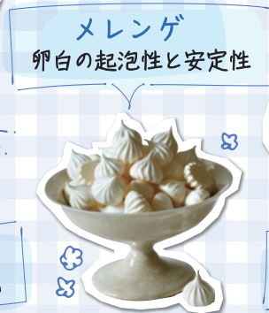
メレンゲ 卵白の起泡性と安定性