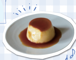
プリン 卵の熱凝固性